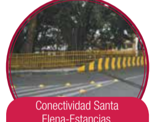
Conectividad Santa Elena-Estancias $3.000 millones