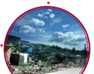
Circuito Vial de las Mirlas $15.049 millones