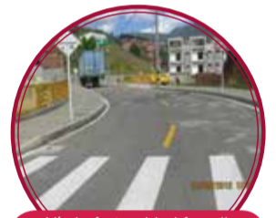
Vía la fraternidad fase II $2.620 millones