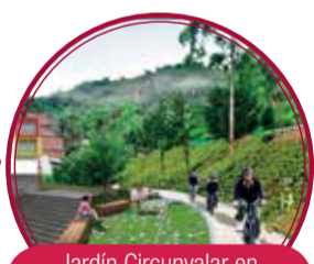
Jardín Circunvalar en las cuatro zonas de la ciudad $65.062 millones