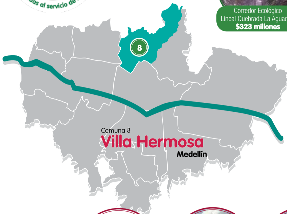
Comuna 8 Villa Hermosa Medellín