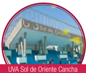
UVA Sol de Oriente Cancha $12.802 millones UVA Sol de Oriente Tanque $5.700 millones