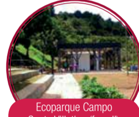
Ecoparque Campo Santo Villatina (fase II) $2.680 millones