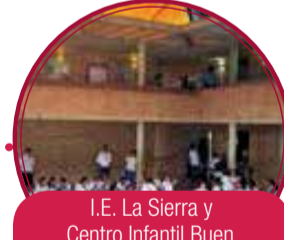
I.E. La Sierra y Centro Infantil Buen Comienzo Comuna 8 $16.266 millones