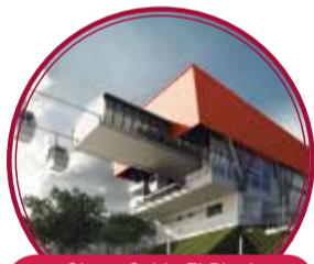
Obras Cable El Pinal $34.241 millones