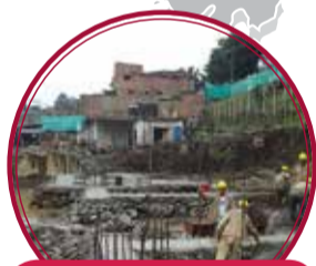
OPV Torres del Este $10.566 millones