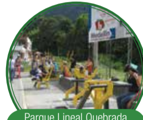
Parque Lineal Quebrada Santa Elena Los Molinos $1.986 millones