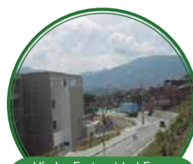
Vía La Fraternidad Fase I y obras complementarias $4.075 millones