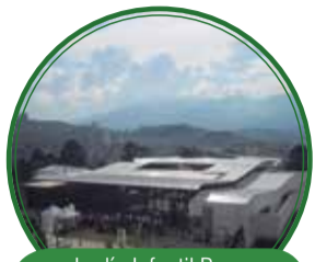
Jardín Infantil Buen comienzo El Pinal - Sucre $5.278 millones