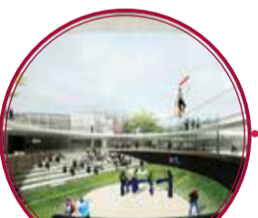
UVA Orfelinato $12.000 millones