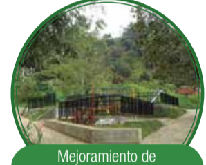
Mejoramiento de espacios públicos y urbanismo $794 millones