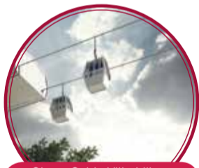
Obras Cable Villa Liliam $26.349 millones