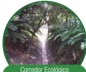
Corredor Ecológico Lineal Quebrada La Aguadita $323 millones