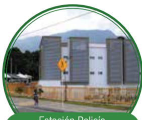
Estación Policía Villa Hermosa $3.151 millones