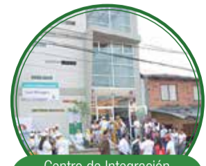
Centro de Integración Barrial Los Mangos $1.003 millones